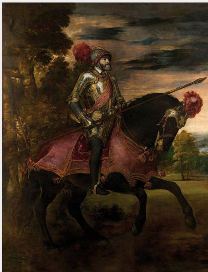
Carlos V, vencedor de la batalla de Mühlberg, 1547. Retrato de Tiziano, 1548. La armadura se conserva en el Palacio Real de Madrid.