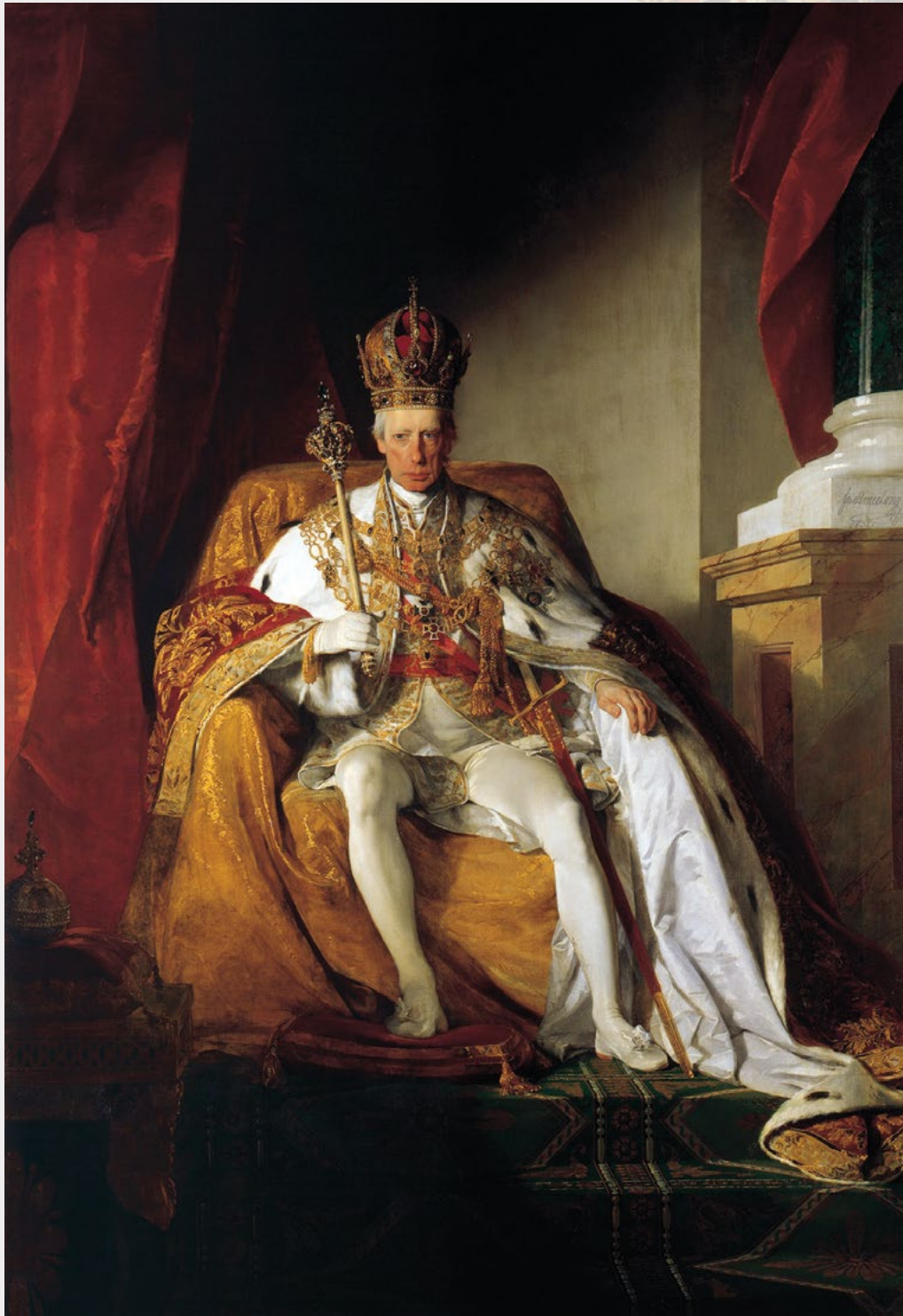
Francisco II , retrato de Friedrich von Amerling, 1832, representado como emperador de Austria en 1832. Luce la corona imperial de los Habsburgo confeccionada para Rodolfo II en 1602.