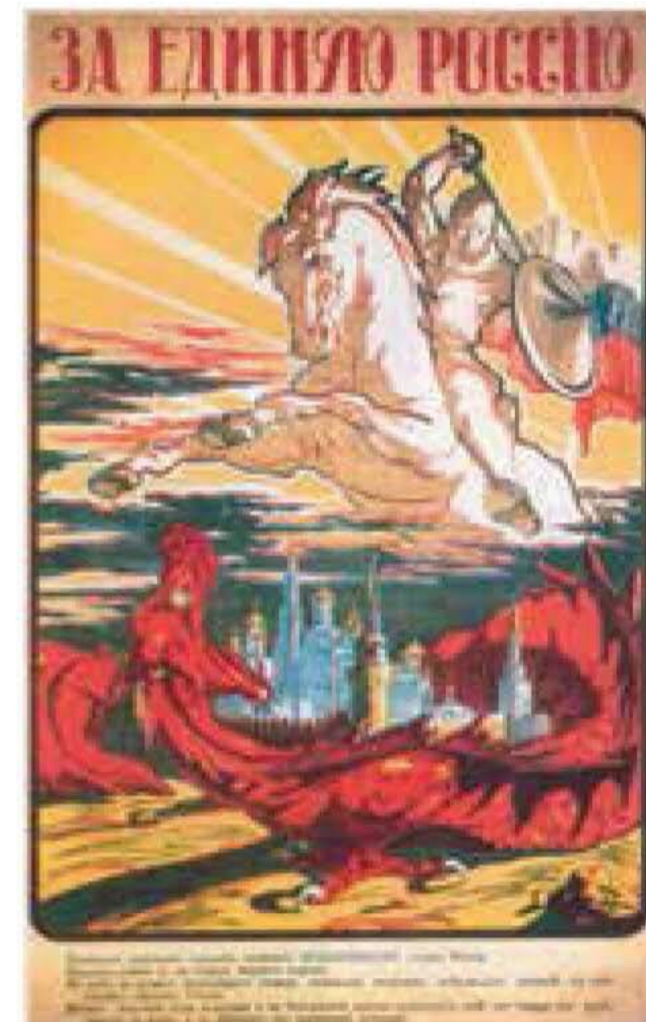
CARTEL del Movimiento Blanco en contra el Ejército Rojo.

sarrollo de un proceso extremadamente complejo tanto por la multiplicidad de actores intervinientes –desde las fuerzas bolcheviques a los eseristas, los conservadores “blancos”, la Legión Checa, las potencias aliadas, los campesinos de los “ejércitos verdes”...– como por los diversos espacios geográficos que abarcó, además de la dilatación en el tiempo del conflicto, que se prolongó durante cuatro años y dejó una profunda huella en la sociedad soviética en forma de devastación y la terrible hambruna que sucedió a la guerra. ■ FRANCESC FABRÉS